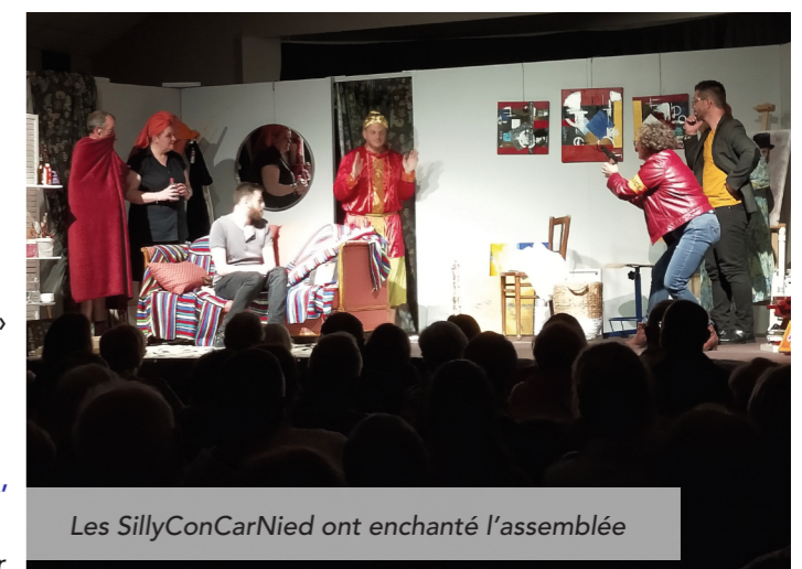
Les SillyConCarNied ont enchanté l'assemblée

C'est le printemps, le territoire se réveille ! Les festivités ont commencé avec le festival communautaire de théâtre Silly sur scène qui a eu lieu du 23 avril au 8 mai à Silly-sur-Nied. Un bon moment passé avec les Silly Con CarNied et le TADA sur deux pièces « Alirazade et les 1001 gaffes » et « Allez ! On danse ! ». D'autres événements soutenus par la CCHCPP suivront durant les mois d'été : Le Forest Jam Festival à Vigy, Le Printemps au château d'Urville à Courcelles-Chaussy, Le Montoy du rire à Ogy-Montoy-Flanville, Sur la remorque du Pat' à Maizeroy, Musikodouv' à Pange, La fête de la patate à Courcelles-Chaussy. Pour toute demande de subvention ; développement@cchcpp.fr