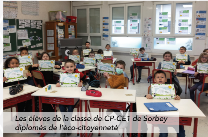
Les élèves de la classe de CP-CE1 de Sorbey diplômés de l'éco-citoyenneté

Savoir trier et recycler s'apprend dès le plus jeune âge ! La CCHCPP a à cœur de sensibiliser la jeune génération à l'origine et au devenir des déchets. Camille Bluma, ambassadrice de tri, a animé de mars à mai des ateliers ludo éducatifs dans les 17 classes de huit écoles qui se sont inscrites. À l'issue de l'animation, les 379 élèves du CP au CM2 se sont vus remettre un diplôme et un petit sachet de graines. Les classes les plus motivées ont participé à un concours de création d'affiches. Les classes lauréates bénéficieront d'une sortie aux Jardins fruitiers de Laquenexy offerte par la CCHCPP. Celle-ci se déroulera le 24 juin 2022 sur toute la journée avec deux ateliers : « Pour un jardin durable » et « Les jardiniers de demain »