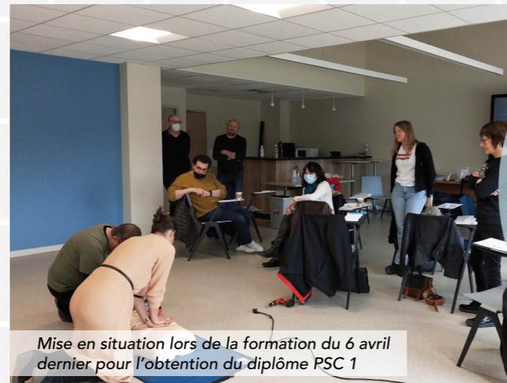
Mise en situation lors de la formation du 6 avril dernier pour l'obtention du diplôme PSC 1

Prochaine formation le 4 juin à Vigy, plus de renseignements sur afprappli.com