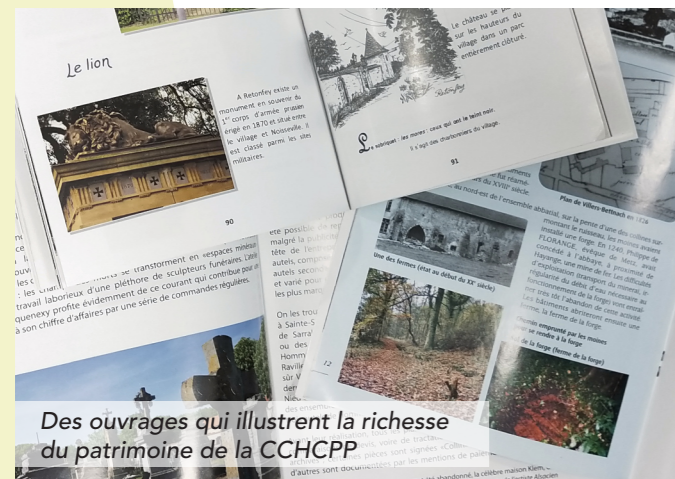
Des ouvrages qui illustrent la richesse du patrimoine de la CCHCPP

Les auteurs d'ouvrages ou les personnes qui auraient des documents en leur possession peuvent se faire connaître auprès de Marine Bellisario à l'adresse courriel developpement@cchcpp.fr .