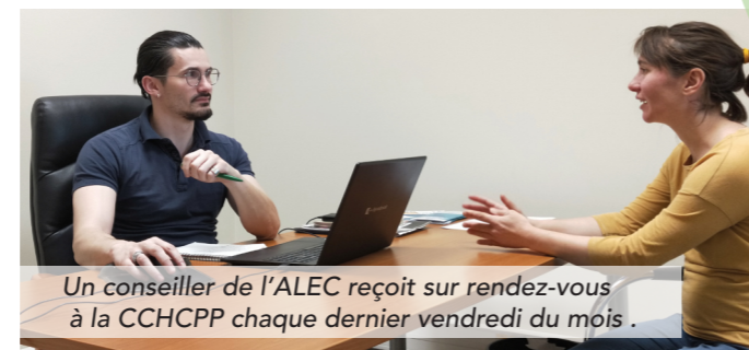
Un conseiller de l'ALEC reçoit sur rendez-vous à la CCHCPP chaque dernier vendredi du mois.

Depuis 2021, la CCHCPP a formalisé un partenariat avec l'Agence Locale de l'Energie et du Climat du Pays Messin (ALEC) pour agir concrètement en faveur de la rénovation énergétique des bâtis. L'ALEC conseille sur les aspects techniques et guide vers les aides financières qui peuvent être reçues. Ainsi, pour tous travaux de changement de chauffage ou d'isolation thermique extérieure, il est possible d'échanger avec les conseillers de l'ALEC par téléphone, de les rencontrer pour étudier les projets de manière plus précise ou encore d'être accompagné du début à la fin des travaux. Le service compétent de la CCHCPP se charge d'instruire les dossiers puis de les faire valider. info@alec-paysmessin.fr ou 03 87 50 82 21