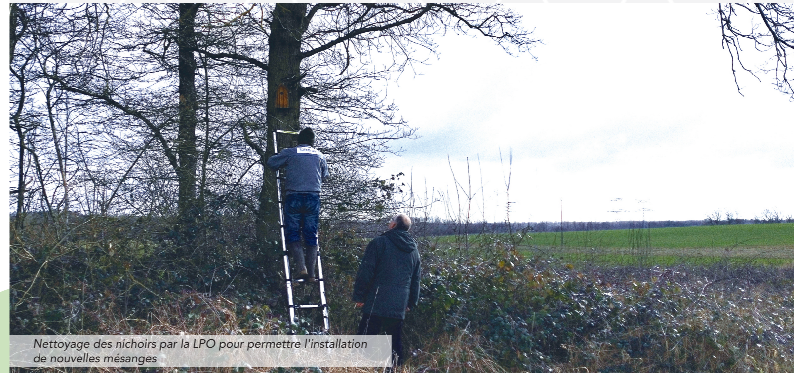
Nettoyage des nichoirs par la LPO pour permettre l'installation de nouvelles mésanges

L'Office français de la biodiversité et les agences de l'eau du territoire ont attribué récemment le label TEN (Territoire Engagé pour la Nature) à la CCHCPP. La collectivité rejoint le « club des engagés » pour trois ans. Cette distinction vise à faire émerger, reconnaître, développer et valoriser des plans d'actions territorialisés. Agir à l'échelle locale permet de mieux répondre aux enjeux et aux spécificités de chaque territoire. En Moselle, seulement trois collectivités ont reçu cet honneur.